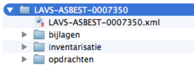
Voorbeeld: Schermafdruck van uitgepakte zip-file

Als op deze link wordt geklikt dan zal de browser aangeven dat de gegevens worden gedownload. Op de plaats waar uw browser gedownloade gegevens bewaart zal een bestand worden gedownload met de naam LAVS-ASBEST-<nummer>.zip, waarbij op de plaats van <nummer> het lavs-projectnummer zal staan. Bijvoorbeeld LAVS-ASBEST-0007350.zip. Dit is een ingepakt bestand. Als u dit bestand uitpakt zal een XML bestand worden getoond en alle bijlagen die op dat moment in het LAVS in het project zijn geupload.